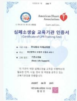
심폐소생술 교육기관 인증서