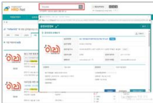
HRD 조회 화면

본 교육원은 고용노동부로부터 3년 인증 받은 공신력 있는 원격 평생교육원이며 고용노동부(장애인인식개선교육, 안전보건교육 外)의 모든 허가를 받은 바, 고객사가 이수해야 하는 연간 법정필수교육을 본원에서 한 번에 수강 할 수 있다는 장점이 있습니다.